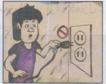
لمس أجزاء التوصيل الغير معزولة