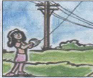
لمس الأسلاك الكهربائية بقضيب